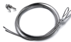
(HSKR) HANGING SET ABHÄNEGSET