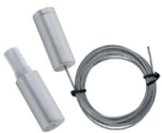
(APPCL) HANGING SET ABHÄNEGSET