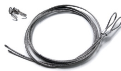
(HSKR) HANGING SET ABHÄNEGSET