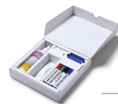
(STARTERKIT) STARTERKIT STARTPACKUNG