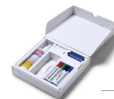
(STARTERKIT) STARTERKIT STARTERSET