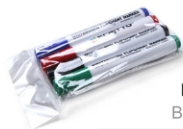
(SETFIXWB) MARKER PENS BOARDMARKER